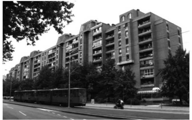
сл. 1. стамбене ламеле уз Булевар краља Александра

Стамбене ламеле уз Булевар одвојене су од саме улице појасом зеленила и дрворедом, који формирају заштитни тампон врло важан у неутралисању негативних утицаја интензивног саобраћаја који се одвија Булеваром краља Александра.