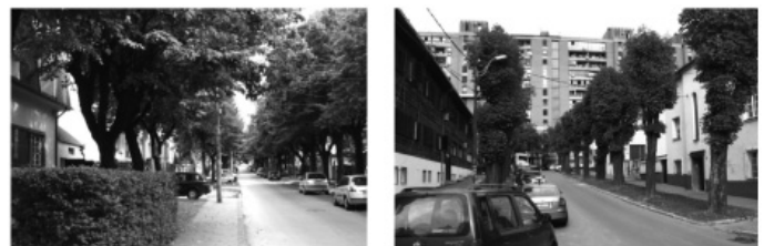
сл.2. Улица Косте Абрашевића сл. 3. Улица Радојке Лакић

Како су стамбене ламеле спратности и до П+8+Пк, а терен од Булеvara краља Александра ка Улици Слободанке Данке Савић у значајном паду, блокови иза ових ламела (Ц27, Ц28 и Ц29) у потпуности су изоловани од ширег окружења и граде препознатљив амбијент. Индивидуално становање у овом делу подручја је просечне спратности П+1+Пк (уз неколико објеката спратности до П+2+Пк). Сем пар приземних објеката, куће су углавном доброг бонитета, нарочито на потезу уз улицу Косте Абрашевића. Ова улица издваја се и по својој широкој регулацији (минимална ширина тротоара 5 m) и богатом и одржаваном дрвореду који даје посебност читавом амбијенту. Сличних карактеристика је и Улица Радојке Лакић, такође са препознатљивим дрворедом, и породичним кућама (вилама) које својом позицијом, тачно на регулацији улице, и уједначеношћу у архитектонском и обликовном смислу, формирају чврст улични фронт.