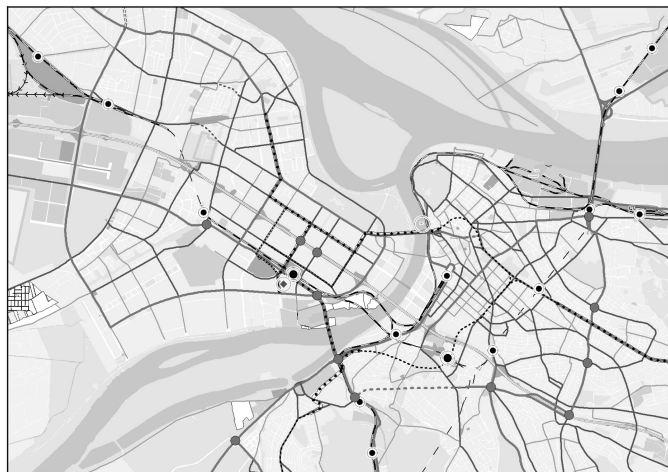
Слика 1. Саобраћај у Генералном плану (Измена Генералног плана Београда 2005/1)

У развоју уличне мреже града једна од најзначајнијих активности предложена у Генералном плану Београда за период до 2021. године као и у Измени Генералног плана Београда 2005/1 је реализација Унутрашњег магистралног полупрстена.